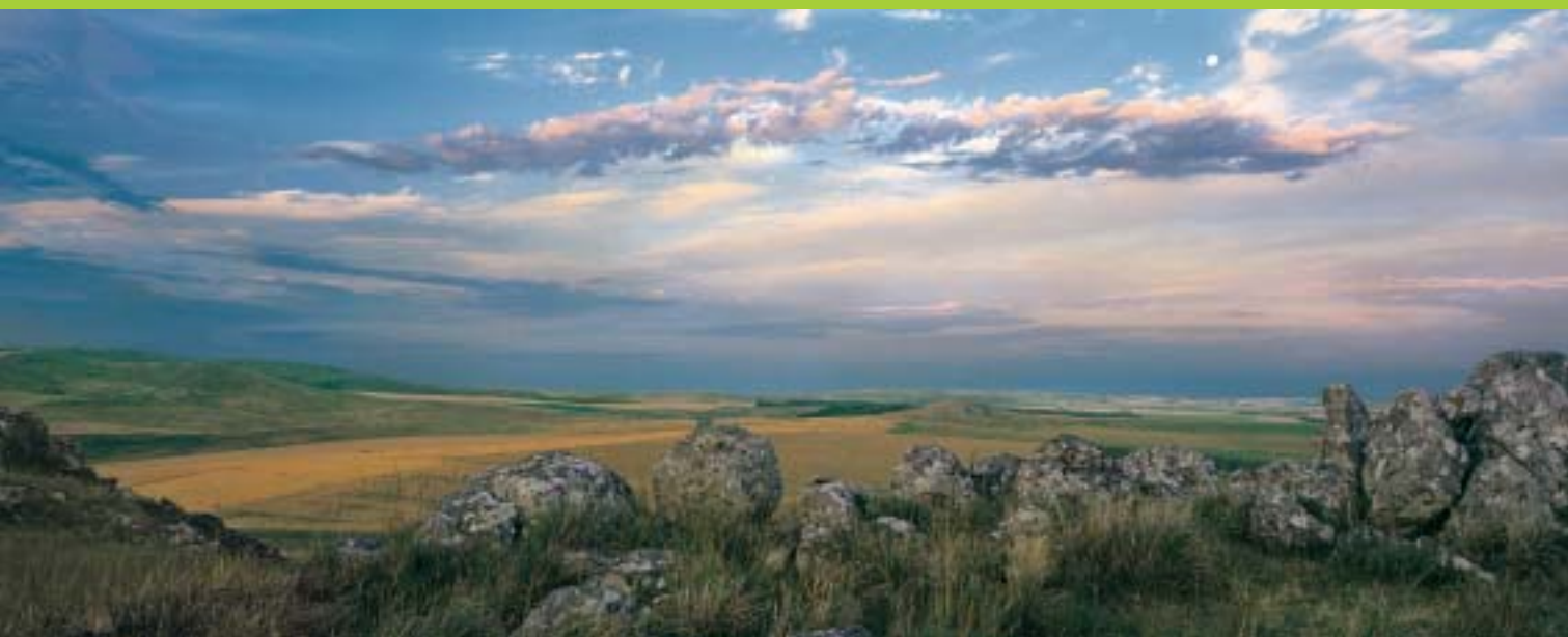
El sistema de Sierra Alta de Vela, ubicado en el sur de la Provincia de Buenos Aires, está sufriendo serios daños ambientales como consecuencia de la actividad minera. Estas sierras, que forman parte del sistema de Tandilia tienen un enorme valor científico ya que sus rocas registran la historia en la cual nuestro continente estuvo unido con África. Existe una propuesta para transformar la belleza de la Sierra Alta de Vela en un parque minero.

ción, donde no se contestan observaciones, y en el que la decisión final hace caso omiso del procedimiento y muchas veces está tomada de antemano. Digamos que sería sensato definir a la Evaluación de Impacto Ambiental como un proceso que estimula a todas las partes a acometer un futuro integrador, que brinda la seguridad jurídica necesaria para poder ponderar los riesgos a la salud y al ambiente, a la luz del conjunto de interrelaciones que se presenten desde la diversidad de posiciones, considerando los costos sociales y económicos involucrados en la concreción del proyecto, los desequilibrios que podría provocar en la comunidad afectada, y los beneficios que se obtendrían.