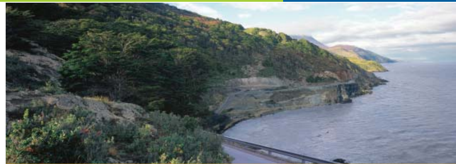
Próximo a la ciudad de Ushuaia, en la Provincia de Tierra del Fuego, existe el único lugar de la Argentina donde el bosque se encuentra con el mar. La construcción de una ruta al lado del Canal de Beagle perjudicará uno de los principales recursos paisajísticos de Usuhia, como puede apreciarse en el fotomontaje de esta foto.

Una línea de alto voltaje ha sido instalada en los Esteros del Iberá, Provincia de Corrientes. Así el segundo humedal en Sudamérica ve degradado su valor escénico y su potencial desarrollo de ecoturismo. Por otra parte, existen antecedentes que señalarían un posible trasvasamiento subterráneo del agua de la represa hidroeléctrica Yacyretá que podría causar un daño irreversible a la extraordina-